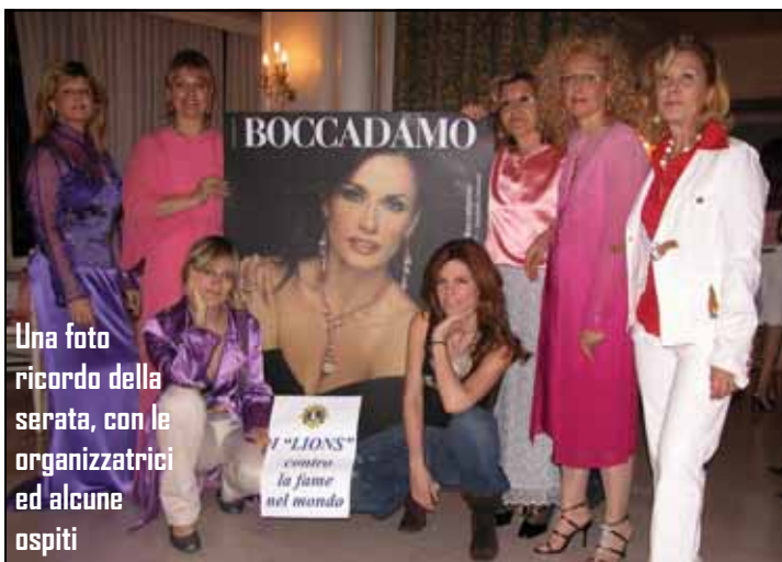
Una foto ricordo della serata, con le organizzatrici ed alcune ospiti

Sfilano per beneficenza le collezioni più belle. Ed è un successo