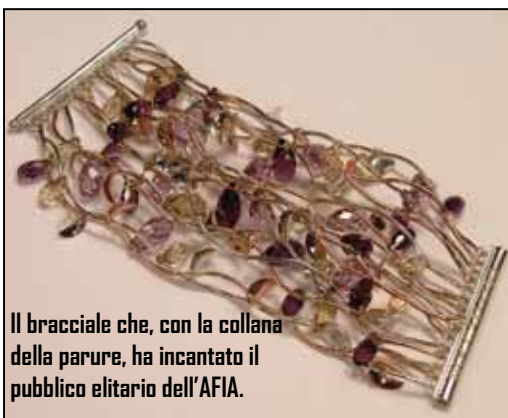
Il bracciale che, con la collana della parure, ha incantato il pubblico elitario dell'AFIA.

di crescita in termini di fatturato e risonanza degna dell'alta moda. Gioielli unici, in cui i cristalli si rincorrono lungo onde di argento, in un dinamismo di petali di luce, e splendono in un susseguirsi di intrecci che crescono, si sommano, prendono forza, come un sentimento d'amore irrefrenabile che esplode in passione. Non ci stupiamo del successo registrato, comprendiamo le esclamazioni di compiacimento giunteci dagli organizzatori dell'evento. Tonino Boccadamo ha dato il meglio di sé nell'intuire e forgiare elementi di moda che hanno fatto onore al suo nome ed al Made in Italy. Come sempre,