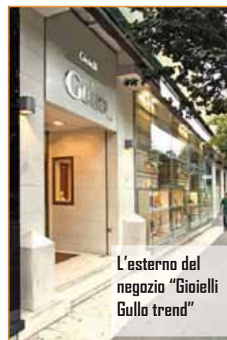
L'esterno del negozio "Gioielli Gullo trend"

Q uesto mese per la nostra rubrica "Clienti D.O.C." abbiamo attraversato lo stretto di Messina, sfidando la calura estiva che qui, nella bella Sicilia, arde di un sole schietto, aggressivo e generoso insieme. E nel cuore della città portuale abbiamo incontrato i titolari, padre e figlio, di due delle gioiellerie che più ci onora annoverare tra i nostri clienti: sarà l'eleganza dei punti vendita, sarà l'attenzione certissima con cui ogni particolare delle vetrine è curato, certo è che a colpo d'occhio capiamo perché nel loro campionario non potevano mancare i gioielli Boccadamo. Eleganza e raffinatezza sono elementi che il brand di Frosinone sa apprezzare sopra ogni altro, ed ai gioiellieri Gullo abbiamo chiesto se la stima è reciproca: