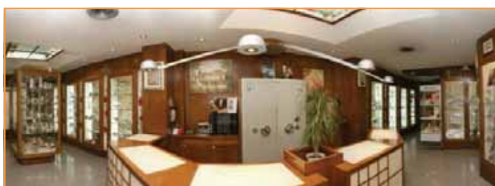
A destra, l'interno del punto vendita "Gioielli Gullo trend". A sinistra, la splendida hall del negozio "Gioielleria Luigi Gullo"

R: E' difficile... Ma credo che finirei con lo scegliere qualcosa dalla linea Seduzioni. La mia preferita!