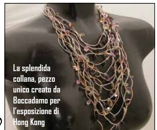
La splendida collana, pezzo unico creato da Boccadamo per l'esposizione di Hong Kong

“ Gioielli unici, in cui i cristalli si rincorrono lungo onde di argento, in un dinamismo di petali di luce ”