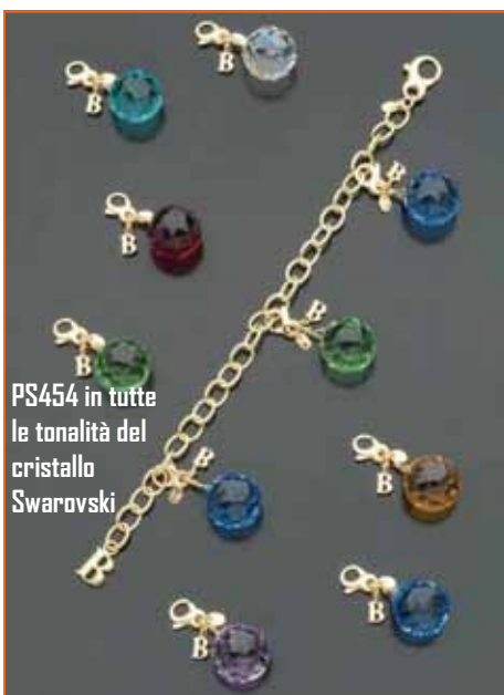
PS454 in tutte le tonalità del cristallo Swarovski