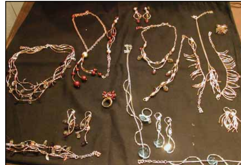
Nella foto alcuni dei gioielli utilizzati per il servizio

ce pensa già alla lucentezza e al fascino dei gioielli BOCCADAMO che presto renderanno la sua bellezza ancora più evidente: al primo piano dello stabile sta per iniziare il servizio che lancerà la nuova campagna pubblicitaria della brand più fashion del mondo del gioiello marcato Made in Italy. E lei, ancora una volta, ne sarà la splendida testimonial.