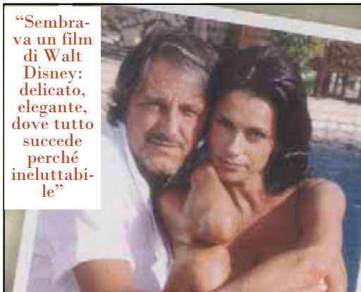
"Sembrava un film di Walt Disney: delicato, elegante, dove tutto succede perché ineluttabile"