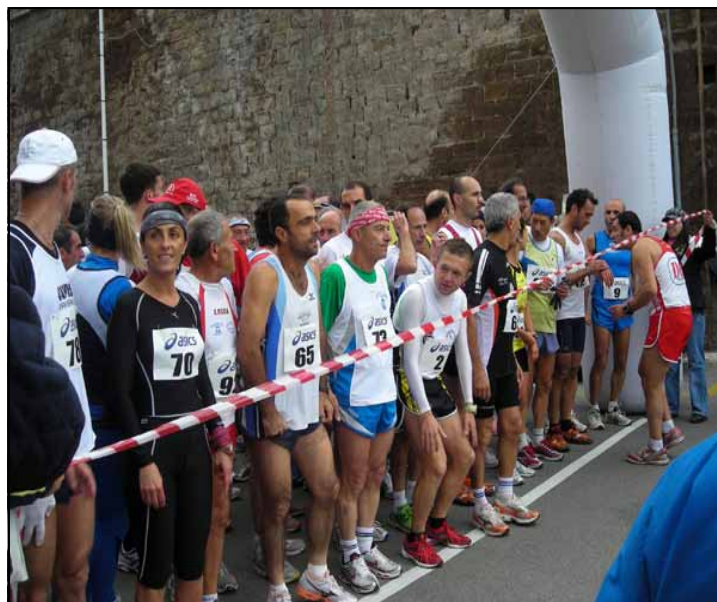
PARTENZA - Nella foto in alto i maratoneti sui nastri di partenza, pronti a darsi battaglia fino all'ultimo respiro.

L'unicità bensì è stata dettata dal fatto che, accanto agli atleti sono scesi in strada, in una gara non competitiva, anche persone diversamente abili. Mettendosi in competizione, con gli altri certo, ma in primis con se stessi.