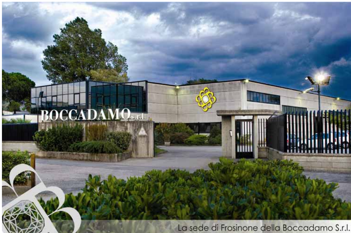
La sede di Frosinone della Boccadamo S.r.l.

Per ricevere gratuitamente il magazine "Boccadamo News" consulta il sito www.boccadamo.com