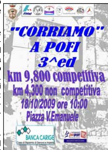
CORRIAMO A POFI - Manifesto della gara podistica tenutasi il 18 Ottobre.