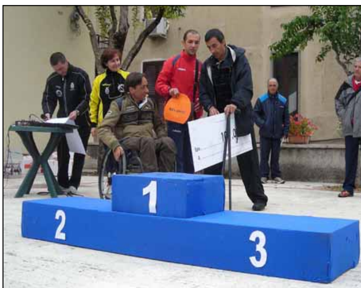
PREMIAZIONE SPECIALE - Nella foto in alto una vittoria che vale doppio. Boccadamo premia 3 categorie di diversamente abili. Una lezione non solo di sport, ma di vita.

Perché ci sono occasioni in cui il podio va oltre il primo, secondo o terzo posto.