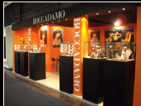
Il punto sulle Fiere