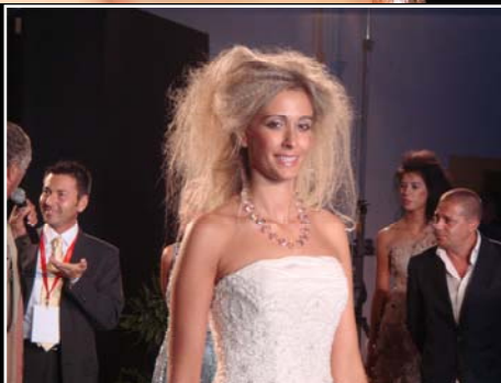
Cinema & Ciociaria 2008